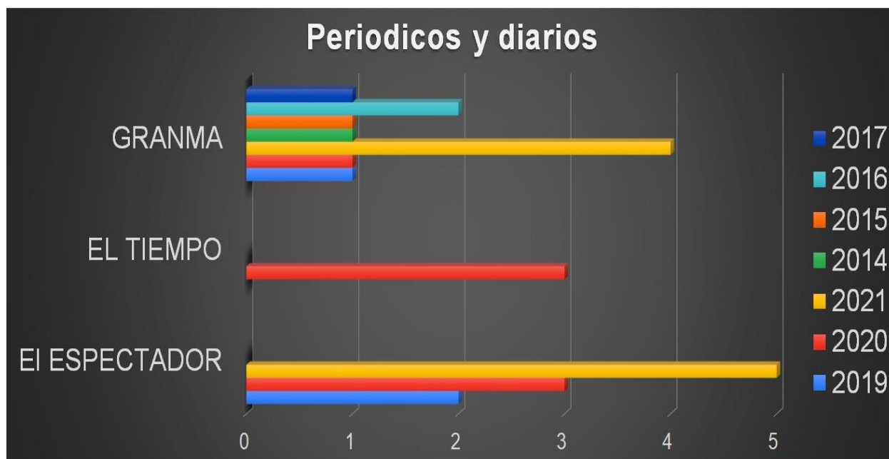
Figura 2. Periódicos y diarios.

política exterior colombiana frente a Cuba. En este orden de ideas, se clasifican las noticias mediante un análisis el cual se determine según su contexto qué tipo de paz es: paz positiva, paz negativa o paz imperfecta.