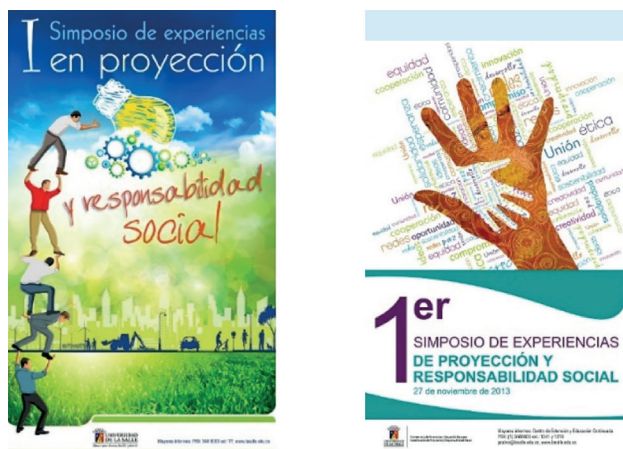
Figura 1. Dirección de Comunicaciones —Universidad de La Salle—