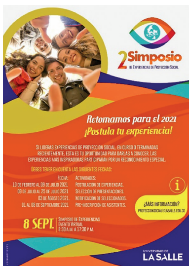
Imagen inicial del II simposio Imagen oficial de promoción del evento

Todo este tipo de apuestas y logros institucionales hacen pertinente que se mantenga la idea de un simposio institucional sobre experiencias de proyección social. Resulta importante que la universidad, además de conservar vigente su reflexión social, continúe aprendiendo de las experiencias acumuladas y las comunique a toda su comunidad universitaria. Así, con las mismas intenciones que se llevó a cabo el primer simposio, se lleva a cabo su segunda versión el 08 de septiembre de 2021, el cual, en esta ocasión, favorecería para promocionar, divulgar y socializar también el contenido del librito institucional n.º 72; y que por motivos de la situación generada por el COVID-19 se realizó de forma virtual.