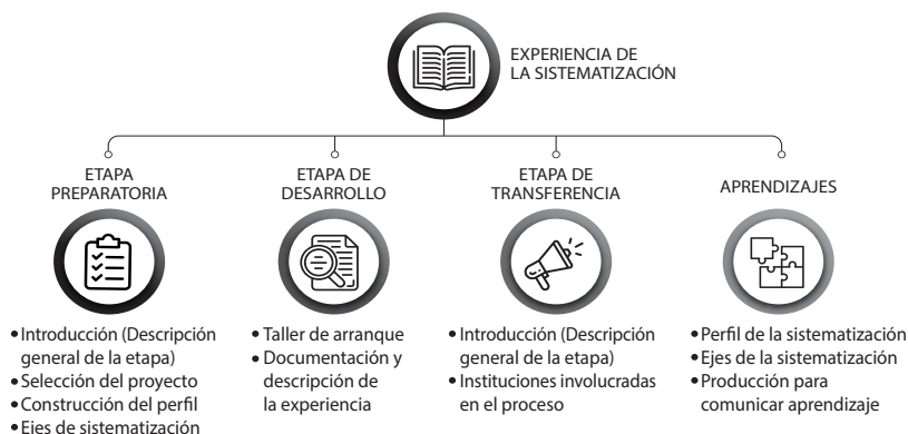
Figura 3. Etapas de la sistematización