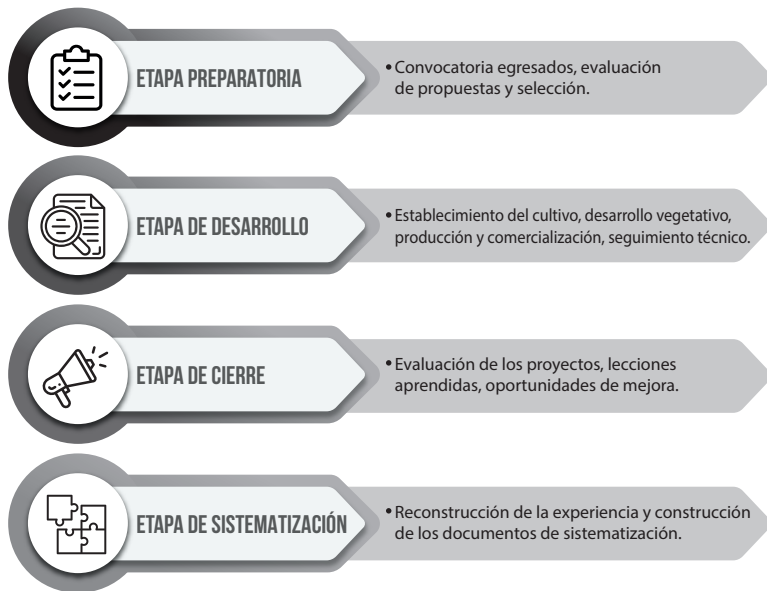
Figura 1. Etapas para el desarrollo de las experiencias y componente técnico

A continuación, se presentan las diferentes etapas para el desarrollo de los proyectos productivos y el componente técnico ejecutados en el marco del convenio.