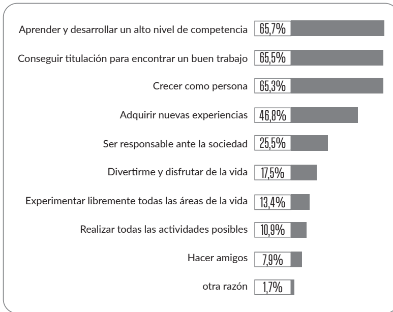
Figura 1. Razones por las cuales los estudiantes de la Universidad de La Salle acuden a un programa académico en educación superior

los estudiantes de la Universidad de La Salle acuden a programas de formación en educación superior motivados por razones diversas [...]. Muchas de estas razones están relacionadas con aspectos profundos de la persona, como la proyección de sus vidas en el tiempo sobre la base de una estabilidad económica. Así, nuestros estudiantes esperan aprender y desarrollar altos niveles de competencia profesional (65%) y que la formación que les brindamos les permita acceder a un empleo de calidad (65%). (p. 113)