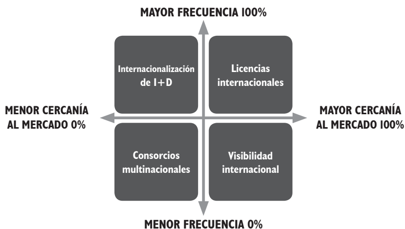
Figura 1. Internacionalización de la investigación

El proceso de inserción universitaria en la internacionalización de la investigación en sí misma, como de sus productos y servicios, se origina en estrategias de participación y cooperación dinámica (tipo empresa manufacturera) donde es posible abordar el mercado con mayores o menores acercamientos y frecuencias (figura 1).