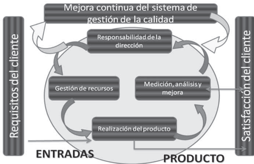
Figura 2. Modelo de un sistema de gestión de calidad basado en procesos.

La figura 2 ilustra las relaciones-vínculos entre los procesos que contienen los capítulos 4 a 8 de la Norma NTC-ISO 9001:2008, donde los clientes cumplen un rol relevante para definir los requisitos como entradas. El seguimiento de la satisfacción del cliente requiere una evaluación de la percepción de éste acerca de si la organización ha cumplido cumple o no sus requisitos.