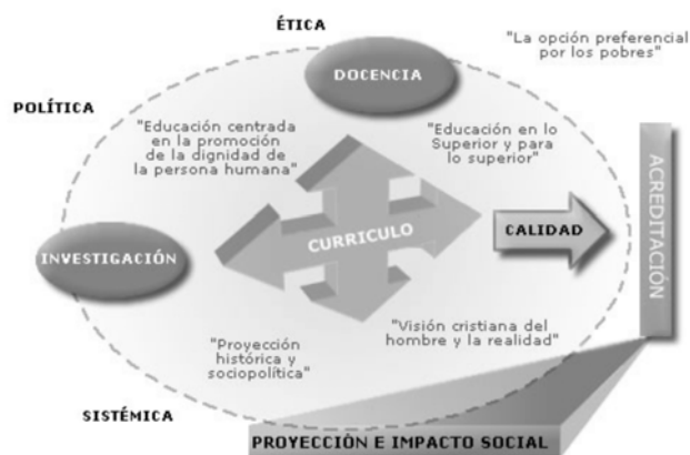
FUNCIÓN DEL CURRÍCULO LASALLISTA

A partir de tal concepción curricular se fomenta la comprensión del sentido y significado del marco doctrinal lasallista, donde las funciones propias de la Universidad de La Salle: ética, política y sistémica, adquieran mayor pertinencia en el contexto histórico nacional e internacional. Así, la función del currículo lasallista es fomentar la trascendencia de lo meramente educativo hacia la realización de los principios y metas institucionales.