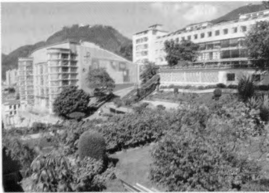
Foto: Vista estado actual

En 1933, en un refinado estilo de inspiración gótica, se construye la Iglesia de la Santa Cruz siguiendo las directrices que el estilo gótico demandaba de acuerdo con sus planteamientos socio-religiosos del momento histórico de su aparición, tales como su distribución en planta con una nave central de proporciones preponderantemente verticales. El planteamiento arquitectónico incluye dos naves laterales ricamente