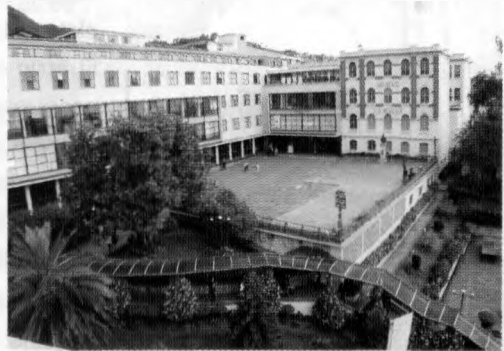
Foto: Vista estado actual