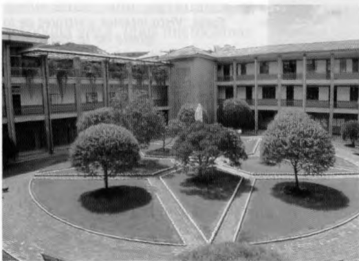
Fotos: Vista exterior y patio interior Sede La Floresta