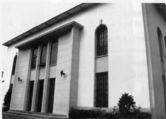
Foto: Casa de la primera sede, 1965

Este proceso se corona hoy en noviembre de 2003 con la inauguración del conjunto de edificios que incluye el de oficinas administrativas, el moderno y amplio edificio de aulas adicionales y la enorme propuesta de zonas de parqueadero cubiertos, de la sede de Chapinero.