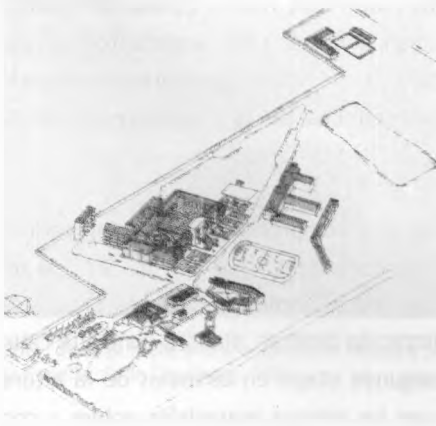
Grafico: Vista aérea Sede La Floresta

Con la visión que ha caracterizado las directivas de la Universidad y teniendo en cuenta las necesidades que generan las carreras relacionadas con la agroindustria, en el año de 1979 se toman en arriendo las instalaciones (Vicerrectoría Académica.