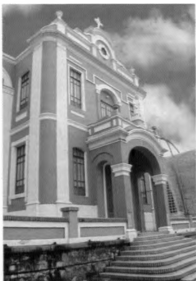
Foto: Fachada CILA

arborizada (Parque de La Salle) que se encuentra a lo largo de la fachada sobre la carrera 6ª.