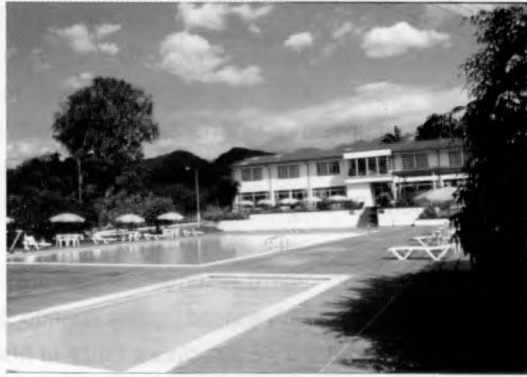
Foto: Vista exterior del Centro de Investigaciones La Isla. Sasaima Cundinamarca

En 1977 se inaugura una moderna, amplia, bien dotada y cómoda sede con un adecuado tratamiento del espacio exterior tanto funcional como paisajístico. La arquitectura de esta sede logra un buen planteamiento del uso de la vegetación típica de la región, generando una agradable y tranquila vista, unos microclimas que hacen confortable la estadia y una volumetría mimetizada con el paisaje.