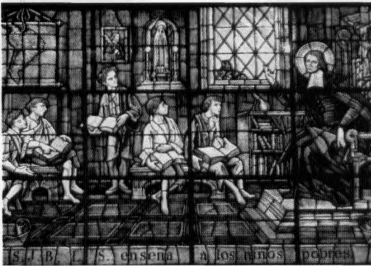
Fotos: Vista interior y vitrales de la Iglesia de la Inmaculada Concepción