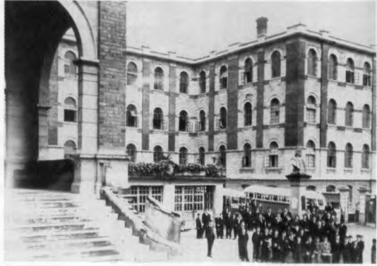
Foto: Vista construcción inicial, s.f.

arquitectónicas, entre 1908 y 1911, los 1.695 m 2 del Museo de Historia Natural y los 2.062 m 2 de lo que hoy en día se denomina como el bloque E. (Oficina de Planta Física. Documento sobre áreas y fechas de todas las construcciones de la Universidad)