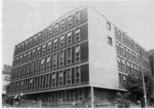
Foto: Segunda Sede, 1967