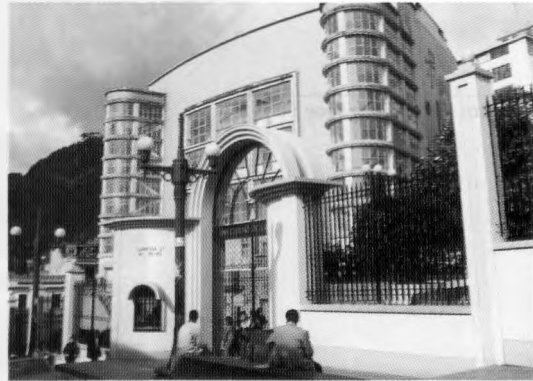
Foto: Acceso Sede Centro

El edificio de la Sede Centro abre sus puertas al creciente número de estudiantes, profesores y directivos el 23 de febrero de 1970. (Vicerrectoría Académica. Volumen 1, 1986: 869) La Universidad acertadamente alquila las instalaciones a su propia Comunidad, generando la reubicación del Instituto de La Salle.