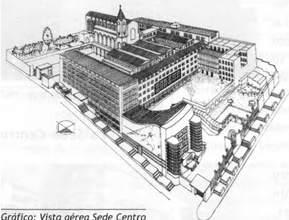
Gráfico: Vista aérea Sede Centro

los límites o bordes del barrio La Candelaria, el sector más antiguo de la ciudad, actuando como filtro entre éste y el histórico barrio Egipto que hoy alberga una de las más altas proporciones de inquilinatos en la ciudad. El vecindario con este tradicional barrio bogotano fue una de las causas por las que esta sede sufrió la histórica arremetida destructora de sus edificios en la sublevación del pueblo en el Bogotazo del 9 de abril de 1948.