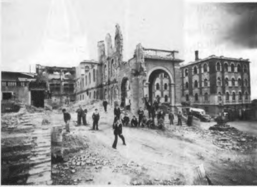
Foto: Vista destrucción 1948