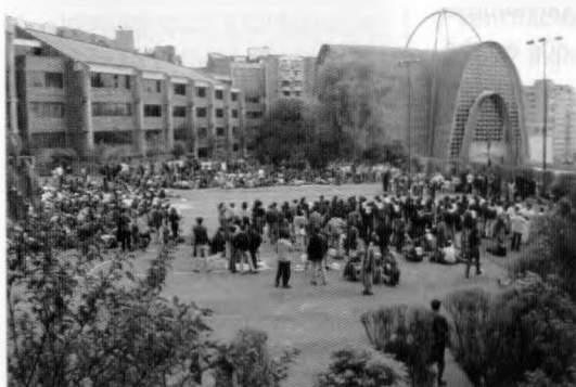
Foto: Vista primera etapa e Iglesia de Nuestra Señora de la Estrella. Sede Chapinero, 1986

En esta sede encontramos la Iglesia de Nuestra Señora de la Estrella, edificio moderno y excelente ejemplo de la arquitectura brutalista que manejó elegantemente Félix Candela en la década del ochenta, con sus propuestas de cáscaras estructurales que cubren grandes luces con construcciones de apariencia