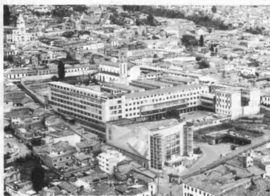
Foto: Vista aérea Sede Centro

La comunidad había iniciado el proceso de construcción a comienzos del siglo XX, más o menos en el año 1908, levantando en un estilo neo-renacentista, de gran magnificencia elegancia y austeridad, los 1.482 m 2 de la escuela localizada en la esquina de la carrera 1 a con calle 10 a y después con las mismas características