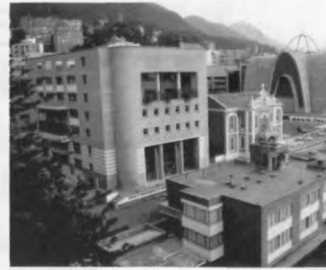
Actual Sede Facultad de Optometría y su Centro de Prácticas, Instituto de Investigaciones Optométricas (Sede Chapinero).

La meta, como desde un principio, es mantener a la Facultad a la vanguardia de la última tecnología y seguir evolucionando para continuar siendo los primeros. 📖