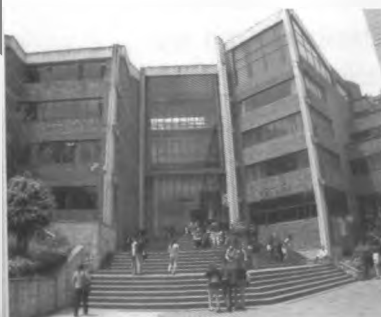
Sede Facultad hasta 1993, Carrera 5 No. 59A - 44 (Sede Chapinero)

Por esa misma época llega de la Universidad de Houston una donación de equipos para mecánica oftálmica y monturas para la práctica de los estudiantes. En 1970 la compañía Rodenstock de Alemania dona una unidad de refracción completa con la última tecnología del momento y se compra también una unidad nueva. Ya en 1971 empieza el Servicio Social de la Facultad.