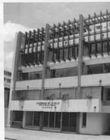
Sede Clínica Social de Optometría hasta 1993, Carrera 15 con Calle 49.

Por esta razón la nueva clínica se divide en estos tres departamentos, organizados cada uno con su Jefe respectivo y, además, una Unidad de Patología Ocular y la Sección de Óptica.