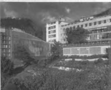
Sede Facultad Calle 11 con Carrera 1ª (actual Sede Centro de la Universidad)