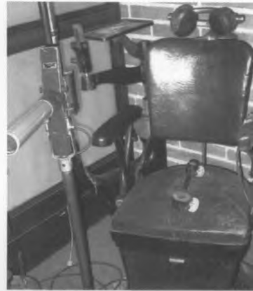
Unidad de Refracción.

Algunos de los primeros equipos optométricos empleados en las actividades docentes de la Facultad.