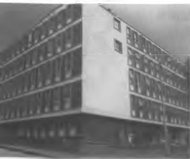
Sede Facultad Calle 43 No. 8-39 (1967)