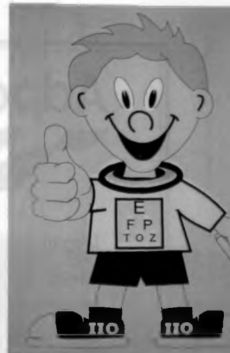
«Visualito»: Imagen del Programa «Miremos a Bogotá con buenos ojos» implementado en 1996.