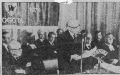
El Excmo. Sr. Carlos Lleras Restrepo, en un momento de la recepción en la Sala de Honor de la Universidad de La Salle, el día 5 de Septiembre de 1979.

El Director de la Universidad de La Salle, el Sr. Carlos Lleras Restrepo, en un momento de la recepción en la Sala de Honor de la Universidad de La Salle, el día 5 de Septiembre de 1979.