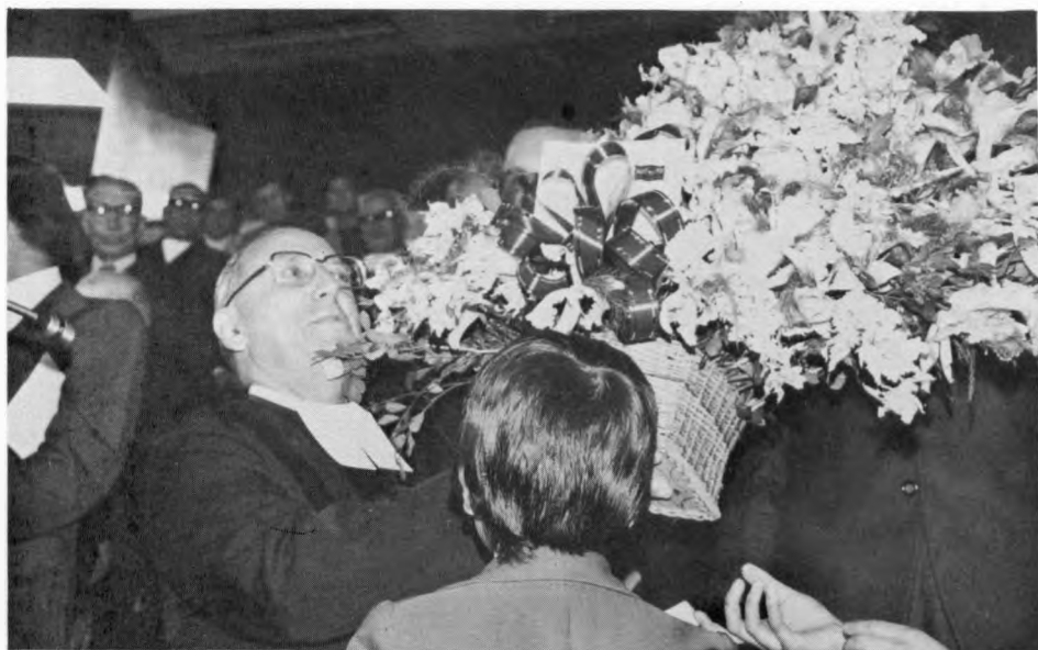
ALUMNOS DEL COLEGIO DE LA SALLE:

ellas su capacidad y su creatividad, que han colocado a la Comunidad Lasallista en una situación envidiable al prepararse a celebrar en el próximo año sus 300 años de labores. Dichas labores fueron iniciadas por San Juan Bautista de La Salle, verdadero creador de espíritus audaces y cristianos convencidos, nuevo apóstol de Jesucristo al dejar todos sus bienes y dignidades humanas por seguirle y dedicar su vida sin ningún impedimento al servicio desinteresado de los más pobres, sin tener en cuenta las barreras que tuviera que vencer, ni los padecimientos que tuviera que sufrir. Con su fundación llegada en feliz coyuntura para la humanidad, el Santo de La Salle nos ha dado toda una legión de maestros educadores orgullosos de su imperecedera función, transmisores del pensamiento de Jesucristo, Maestro por excelencia , y seguidores de las enseñanzas de San Juan Bautista de La Salle; enseñanzas del todo ajenas a los distingos raciales, políticos y sociales, despreocupados de la riqueza material del individuo, buscadores de un constante y eficiente servicio a la comunidad social, ofreciendo su amor fraterno para todos y ayuda indefectible para el engrandecimiento, progreso y bien de la misma.