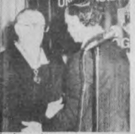
El hermano José Pablo Basterrecchia, superior mundial de la congregación lasallista.

El hermano José Pablo Basterrecchia, superior mundial de la congregación lasallista, llegó a Bogotá el día 5 de Septiembre de 1979.