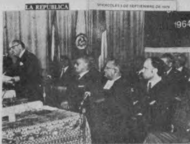
El Excmo. Sr. Carlos Lleras Restrepo, en un momento de la recepción en la Sala de Honor de la Universidad de La Salle, el día 5 de Septiembre de 1979.